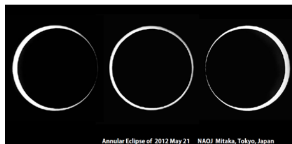
図2 2012年5月21日の金環日食