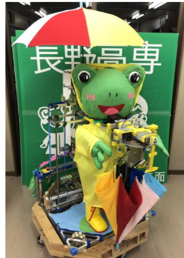
図 4. B チーム ロボットの写真。

タート前が縦 1000 mm × 横 770 mm、高さ 1180 mm、スタート後に縦 1350 mm × 横 1210 mm × 高さ 1620 mm に展開します。重量 24.3 kg です。