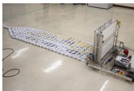
図 1. A チーム ロボットの写真.

た長野高専 A チームのメンバーが中心となって, 再集結したチームです. チーム名にもあるようにドミノを立てるパフォーマンスを行います.