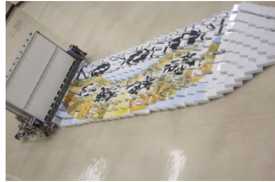
図 3. A チーム 地区大会で立てたドミノ。

図 3 に示すように、カエルをモチーフにしたロボット「ぴちゃん」がチームメンバーと一緒に踊るパフォーマンスを行います。ロボットのサイズは、ス