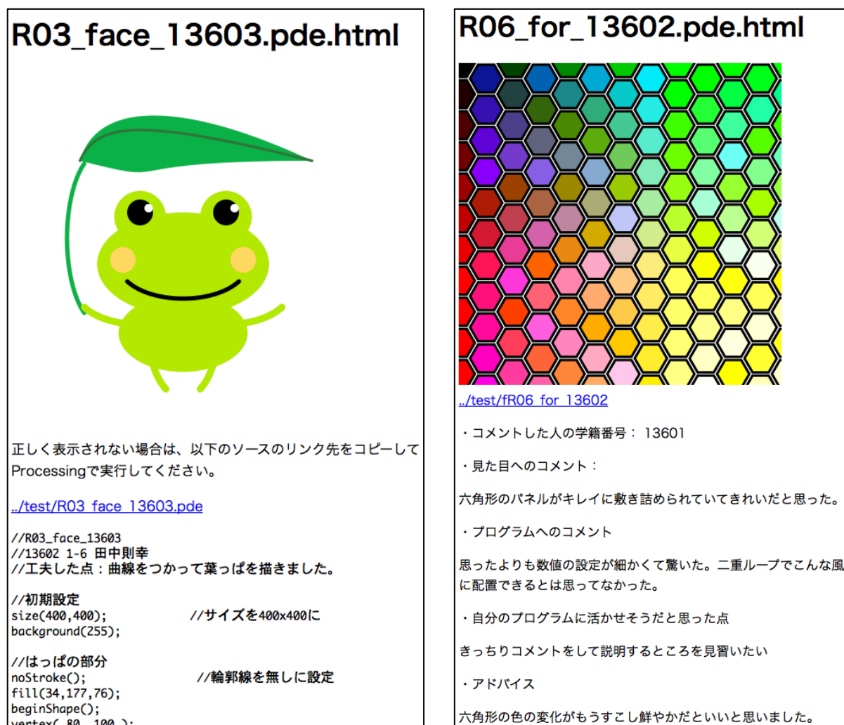
図2 閲覧ウェブページ上の学生が提出した課題プログラム例（左）と 閲覧ウェブページ上に掲載した課題作品への評価コメントの例（右）

ントをフィードバックするために課題閲覧ウェブページに、収集した各学生の課題プログラムに対する評価コメントを付与したページの作成を行い、学生相互で閲覧できるようにした。その例を図2（右）に示す。このページでは、プログラムのソースコードの表示を省略し、実行結果の下部に評価コメントを表示した。学籍番号を表示することで、どの学生から評価コメントを受けたかがわかるようになっている。